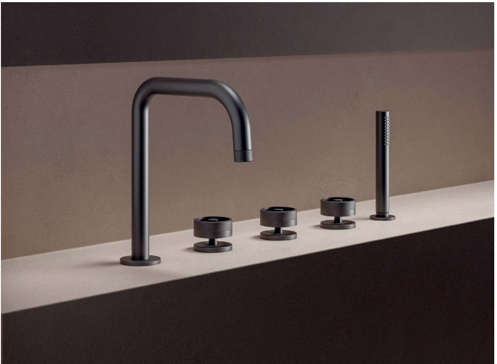
The cylindrical and suspended handle of the Rota collection refers to the image of the gear and to the industrial world.