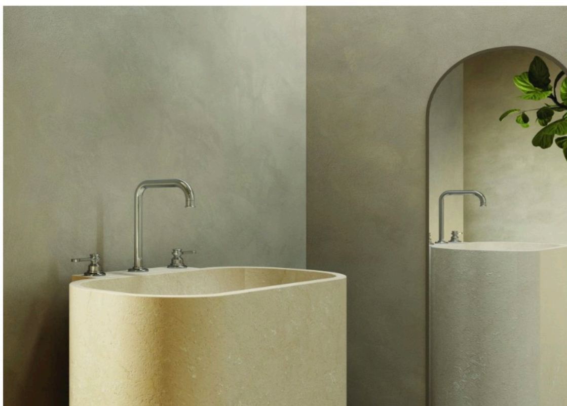
La nuova serie di miscelatori Faro

Il bagno non è più solo uno spazio funzionale, ma un ambiente intimo dove riscoprire la propria essenza. Botte abbraccia questa visione, proponendosi come un elemento capace di esprimere identità e creare un'atmosfera unica. Le sue linee armoniose instaurano un dialogo profondo con chi lo utilizza, trasformando i gesti quotidiani in esperienze sensoriali e appaganti.