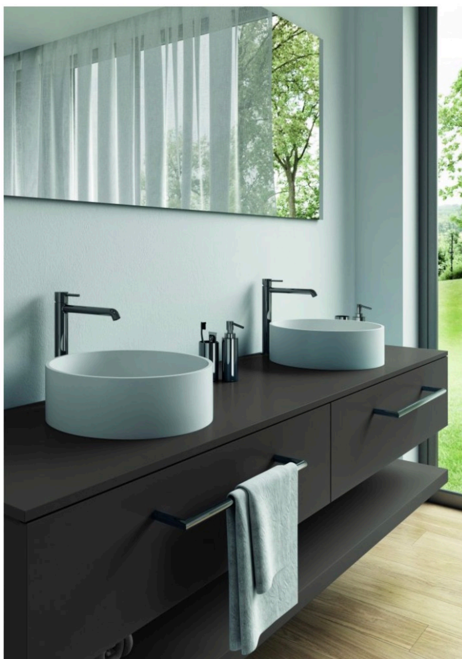
La serie Phi

Tra le varie novità di prodotto presenti nello showroom di Brera troviamo Faro , la nuova serie di miscelatori firmata CRISTINA Design Lab , dove design e innovazione si incontrano per trasformare il tuo bagno in un'esperienza di stile e benessere. Come il faro che domina le coste, la serie Faro emerge come un punto di riferimento nell'ambiente bagno. Non si limita a illuminare, ma definisce, guida e dona carattere.