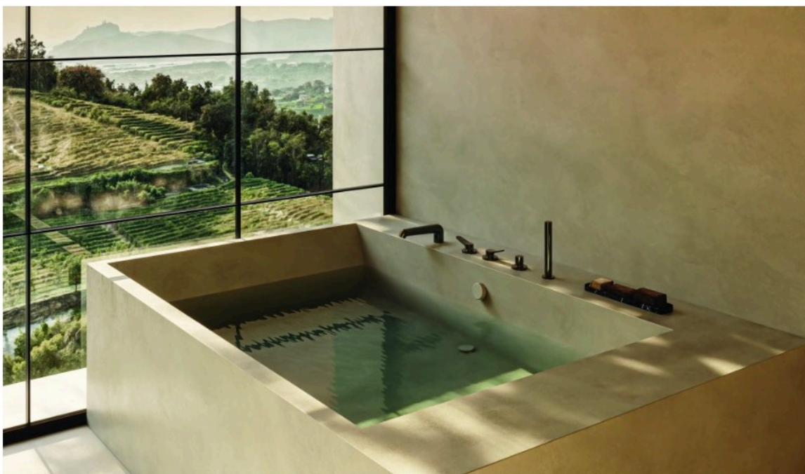
Botte, un linguaggio di sinuosità ed equilibrio

Progettata da angelettiruzza design , la nuova serie 2025 di CRISTINA Rubinetterie celebra la perfetta fusione tra estetica e funzionalità, regalando un'esperienza sensoriale che trae ispirazione dalla natura. Botte racconta un linguaggio di sinuosità ed equilibrio . Ogni dettaglio è stato curato con precisione, con particolare attenzione alla bocca d'erogazione, risultato di uno studio mirato a creare un raccordo impeccabile. Questo elemento restituisce al miscelatore un' armonia ispirata alle forme naturali : una goccia d'acqua, una duna modellata dal vento, linee morbide che richiamano delicatezza e serenità.