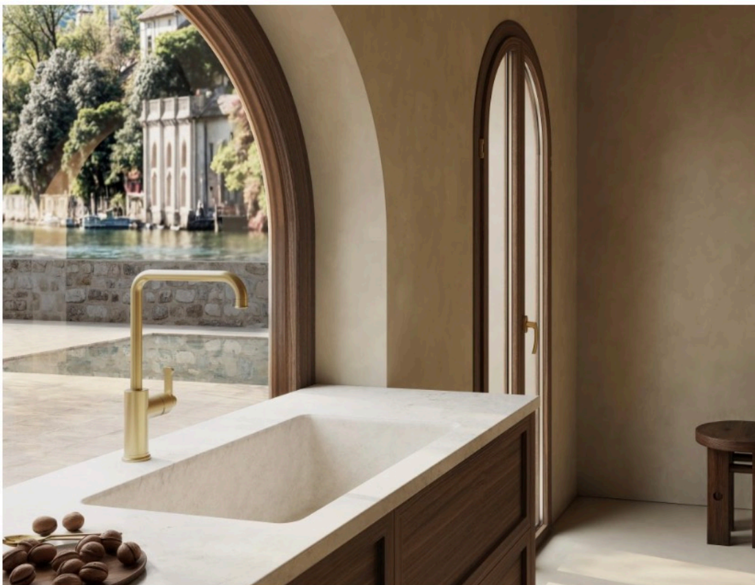
La linea Faro per la cucina

La cucina è il cuore pulsante della casa, uno spazio in cui estetica e funzionalità si incontrano. Tre nuovi miscelatori in acciaio inox , pensati per chi cerca un perfetto equilibrio tra estetica, innovazione e prestazioni. L'essenzialità delle forme si unisce alla solidità di un materiale scelto non solo per la sua resistenza, ma per la capacità di interpretare lo spazio con eleganza e rigore. Proposta anche la finitura nero opaco, alternativa sofisticata all'acciaio spazzolato, che amplia le possibilità progettuali, donando carattere e contemporaneità a ogni contesto. Ogni dettaglio è studiato per offrire un'esperienza d'uso intuitiva e fluida, dove ergonomia e funzionalità si fondono armoniosamente.