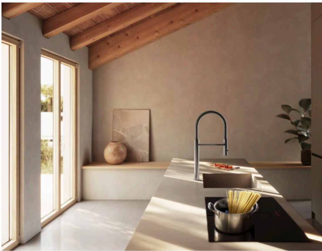
I miscelatori in acciaio inox

La cucina è il cuore pulsante della casa, uno spazio in cui estetica e funzionalità si incontrano. Tre nuovi miscelatori in acciaio inox , pensati per chi cerca un perfetto equilibrio tra estetica, innovazione e prestazioni. L'essenzialità delle forme si unisce alla solidità di un materiale scelto non solo per la sua resistenza, ma per la capacità di interpretare lo spazio con eleganza e rigore. Proposta anche la finitura nero opaco, alternativa sofisticata all'acciaio spazzolato, che amplia le possibilità progettuali, donando carattere e contemporaneità a ogni contesto. Ogni dettaglio è studiato per offrire un'esperienza d'uso intuitiva e fluida, dove ergonomia e funzionalità si fondono armoniosamente.