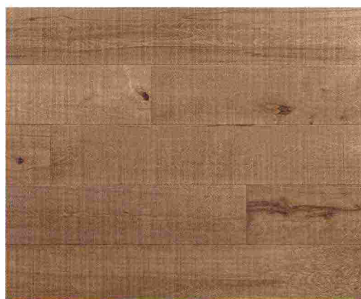
Km zero. Assi del Consiglio è un parquet lavorato artigianalmente e trattato con vernici e colle eco, all'acqua. A tre strati: abete, betulla e fuori, a vista, il faggio, in diverse finiture (nella foto, Foresta viva) e certificato: il bosco da cui proviene è a soli 25 km dalla sede produttiva. itlas.com