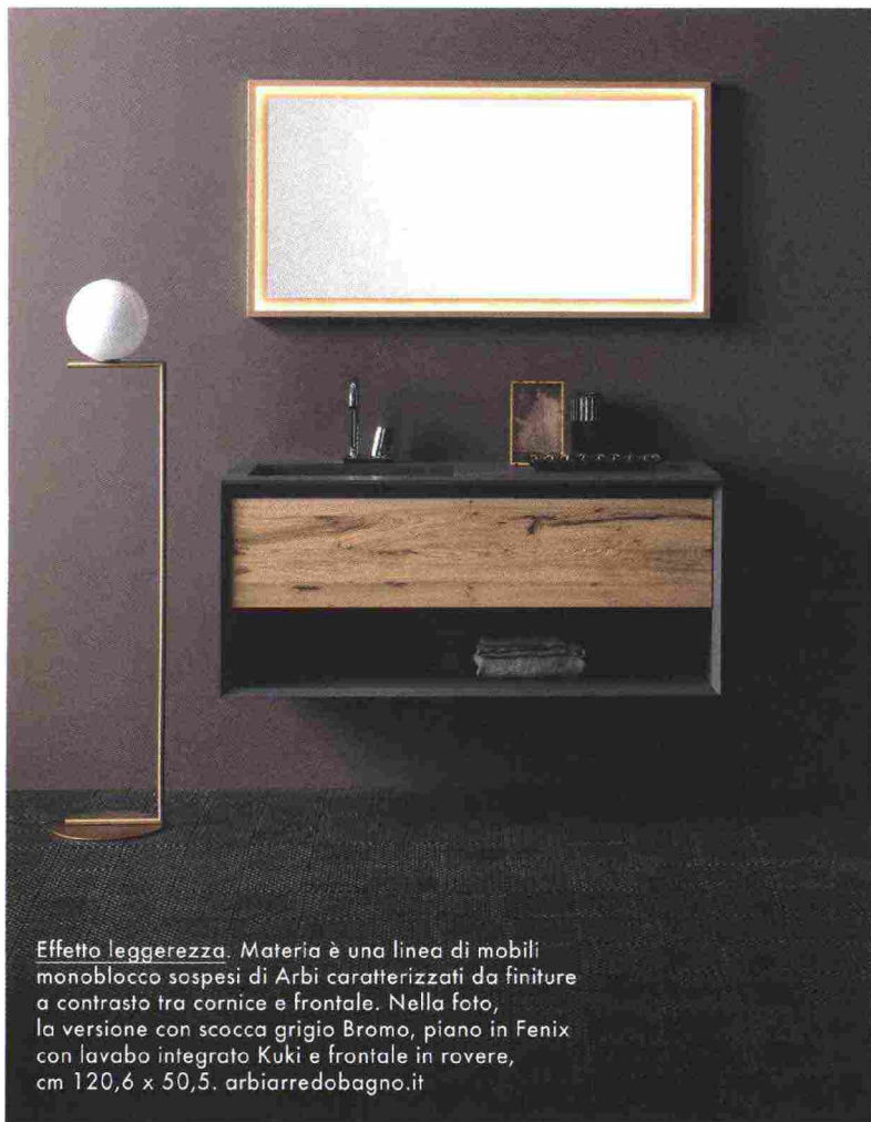
Effetto leggerezza. Materia è una linea di mobili monoblocco sospesi di Arbi caratterizzati da finiture a contrasto tra cornice e frontale. Nella foto, la versione con scocca grigio Bromo, piano in Fenix con lavabo integrato Kuki e frontale in rovere, cm 120,6 x 50,5. arbiarredobagno.it