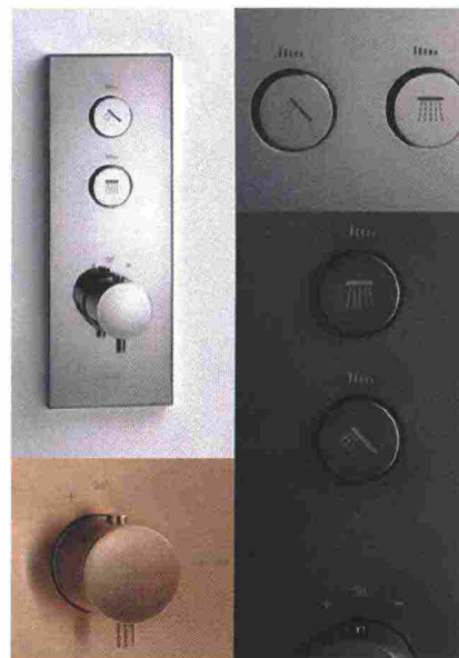
Linee eleganti. Multifunzione il miscelatore Thermo Up di Makio Hasuike per Cristina Rubinetterie. Una centralina di comando, in 4 nuove finiture, per doccia o vasca, che gestisce fino a 3 uscite d'acqua in contemporanea. Si attiva premendo i pulsanti e ruotandoli per controllare la portata.