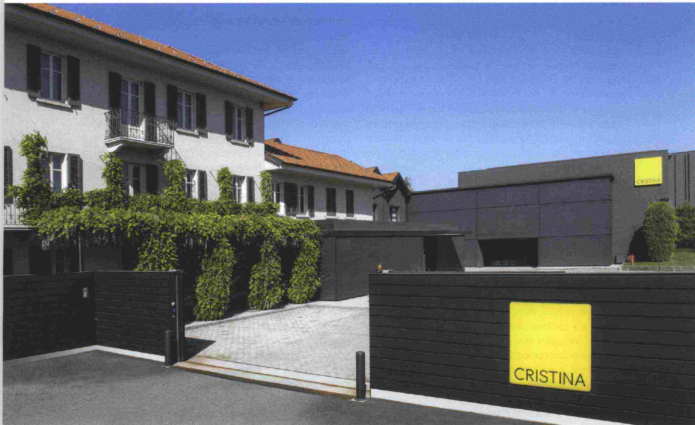
La sede di Cristina Srl a Gozzano, Novara