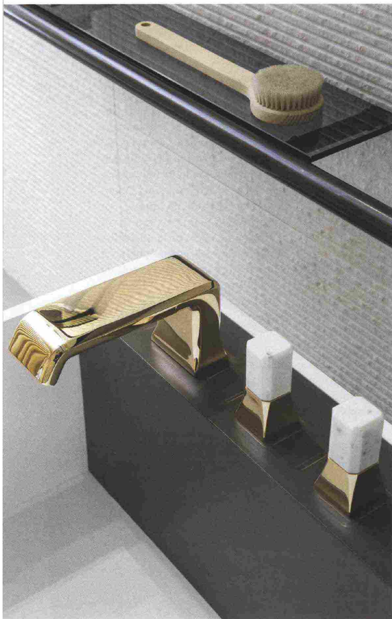
La collezione Italy

“È NOSTRA FERMA INTENZIONE MANTENERE LA RETE DISTRIBUTIVA E COMMERCIALE ITALIANA DI CRISTINA INDIPENDENTE DA QUELLA DI CALEFFI”